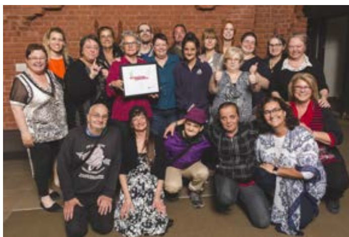
Projet « Ondée de mots » Prix de l'Initiative Éducation-culture Grands prix culturels de Trois-Rivières