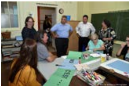
Visite du Ministre Sébastien Proulx avec le député Pierre-Michel Auger

COMSEP s'implique dans la communauté soit en initiant divers projets de mobilisation, soit en collaboration avec d'autres organisations ou encore en appuyant des initiatives porteuses. Cette implication témoigne des efforts déployés de concertation et de partenariat ainsi que d'une volonté d'exercer un leadership pour lutter contre la pauvreté, l'analphabétisme et promouvoir le développement social.