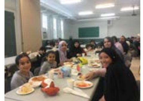
Fête pour la Journée de l'alphabétisation familiale