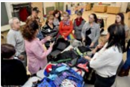
Formation aux bénévoles des Friperies