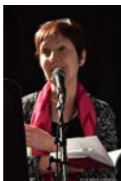
Des poètes professionnels et des personnes en apprentissage à COMSEP prennent la parole au Festival international de la poésie de Trois-Rivières.