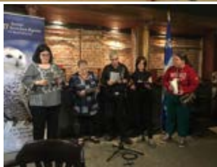
Printemps des Beaux Parleurs.