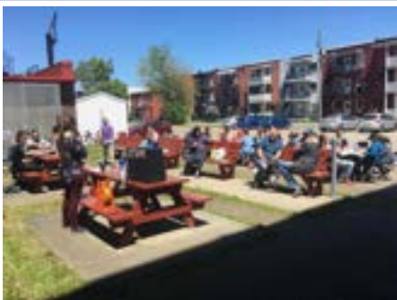
Dîner du comité vert avec les locataires