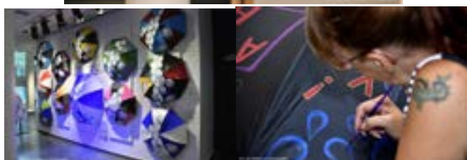
Exposition « Ondée de mots » qui a remporté un Grand prix culturel à la ville de Trois-Rivières dans la catégorie « Éducation ».