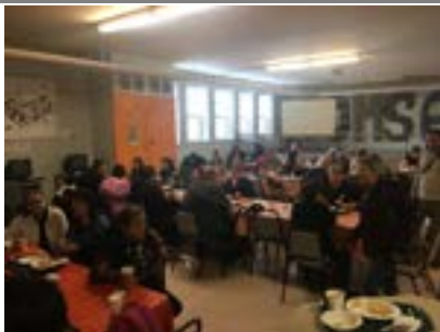
Brunch de la rentrée