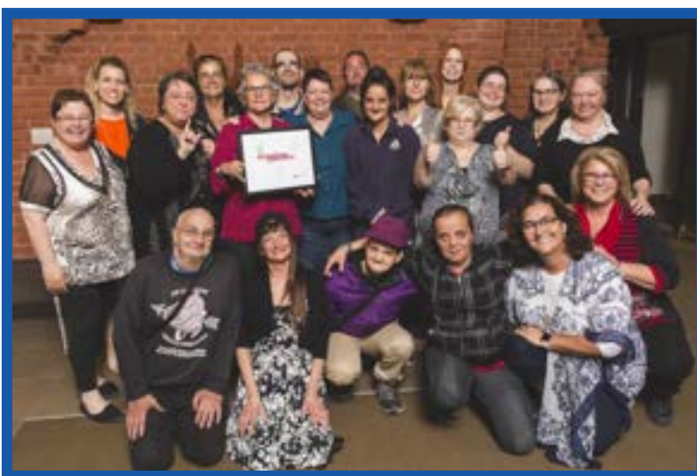
Nos artistes récipiendaires du Prix Culture-Éducation de Culture 3R

Centre d'organisation mauricien de services et d'éducation populaire (COMSEP)