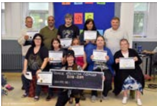
Certains participants et participantes affichant fièrement leur diplôme lors de la remise des diplômes.