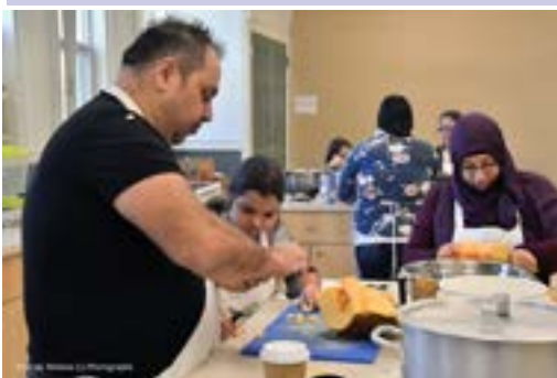
Décoration de citrouilles