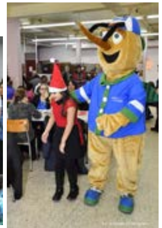
Fête de Noël avec les enfants