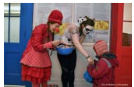
Halloween Distribution de bonbons