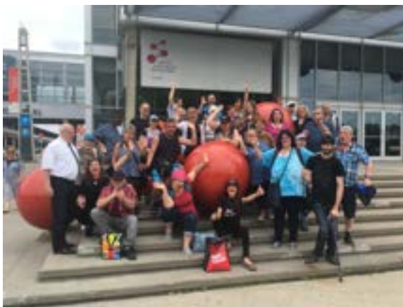
Voyage fin d'année