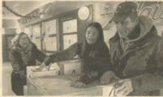
La distribution des paniers de Noël a été menée dans le plaisir et la joie dans chacune des écoles, dont ici à l'école intégrée des Forges, pavillon le Petit Bonheur de Trois-Rivières.

Ce dernier remarque que les élèves qui ont participé au projet peuvent ainsi faire des choix plus appropriés pour les familles concernées, donner des jouets qui intéresseront les enfants de la