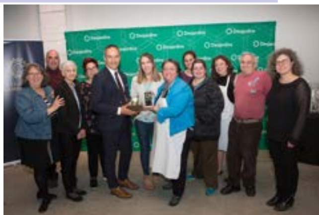
Prix reçu au Gala des Chamberland Prends ma place... pour une journée prix projet mobilisateur Projets déposés par COMSEP et gagnants: Séminaire St-Joseph prix partenariat Projet Les 3 Sœurs prix concertation