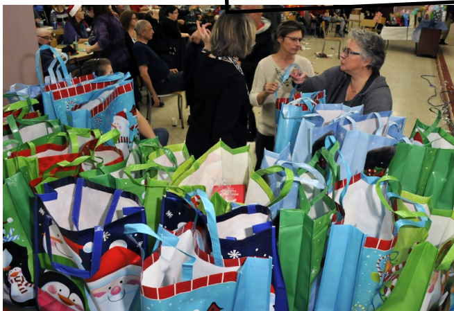
La remise des 30 buffets des Fêtes et de 15 sacs d'épicerie

Nous désirons remercier Les Rôtisseries Ti-Coq pour leur merveilleuse commande de 30 poulets rôtis offerts pour nos buffets des Fêtes. Ce qui a fait de nos paniers un grand succès . .