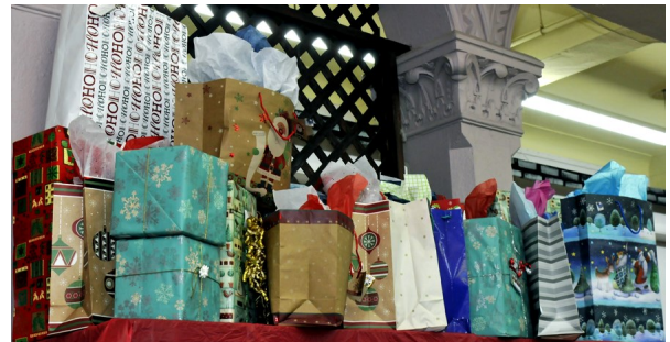
Plus d'une centaine de prix de présences

Nous désirons remercier Les Rôtisseries Ti-Coq pour leur merveilleuse commande de 30 poulets rôtis offerts pour nos buffets des Fêtes. Ce qui a fait de nos paniers un grand succès . .