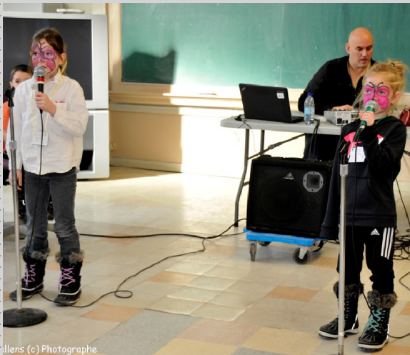
Ilens (c) Photographe