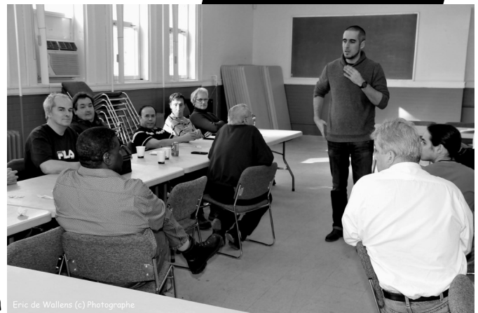
Eric de Wallens (c) Photographie

Après le dépouillement des votes, c'est Richard qui a remporté les élections. Bravo Richard !